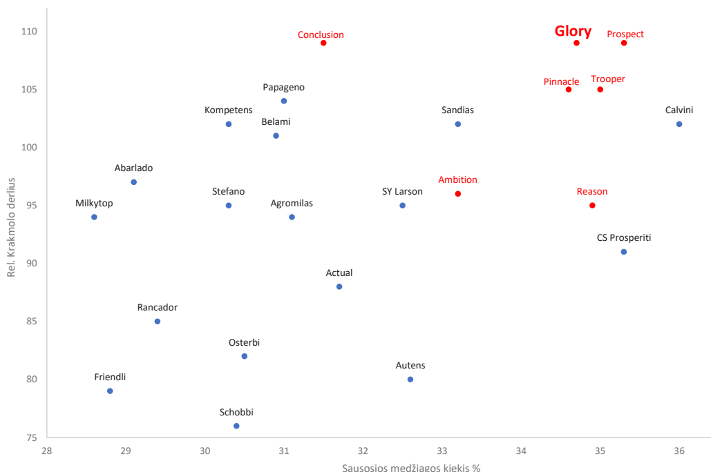
Krakkmo derliaus nacionaliniai bandymai Švedijoje 2020 metais, 4 bandymai

Labai stipri universali veislė, ypač tinkama auginti šaltoje aplinkoje. Glory yra saugi ir tvirta krakkmo tiekėja silosui. Glory taip pat yra labai aukšto ir saugaus derlingumo CCM ir grūdinių kukurūzų veislė, pasižyminti mažu toksinų kiekiu. Glory pasižymi labai geru ankstyvumu, ankstyvu žydėjimu, ankstyva branda ir dideliais kūbeliais su uždara luobele ant stipraus augalo. Per kelerius metus Glory taip pat įrodė, kad yra atspariausia vėjui Skandinavijoje auginama veislė.