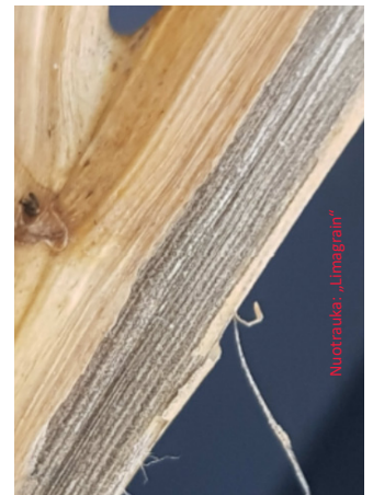
Nuotrauka kairėje: ankstyvieji verticiliozės simptomai, vienpusė bronzinė stiebų spalva. Vėliau audinys miršta, matomi juodi mikroskleročiai (nuotrauka dešinėje).