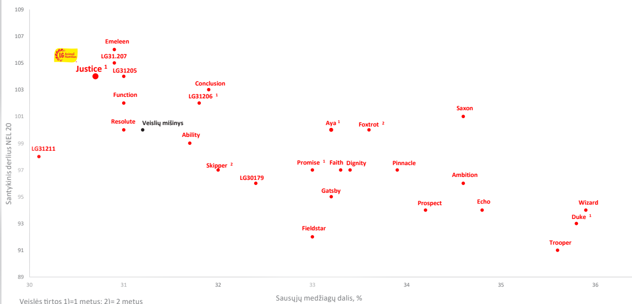
Nacionaliniai Danijos tyrimai, 2017–2019 m. (19 bandymų)

JUSTICE yra nauja vidutinio ankstyvumo kukurūzų veislė. Jai būdingi aukšti augalai vešlia lapų mase ir vienodomis didelėmis burbulėmis. JUSTICE užtikrina subalansuotą pašaro kokybę, pasižymintį dideliu krakmolingumu ir laštelienos virškinamumu. Ši kukurūzų veislė parodė didžiausią krakmolo kiekio rezultatą tarp ankstyvųjų veislių 2022 m. Lietuvos veislių ūkinio naudingumo tyrimų metu.